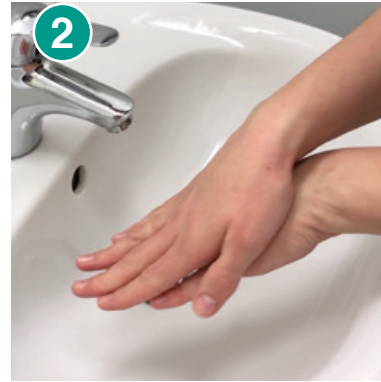
2 Handfläche über Handrücken reiben – Hände wechseln und wiederholen