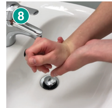
8 Handgelenk mit Handfläche reiben – Hände wechseln und wiederholen