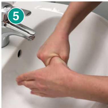
5 Kreisendes Reiben des Daumens in der geschlossenen Handfläche – Hände wechseln und wiederholen