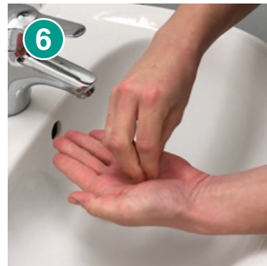
6 Kreisendes Reiben mit geschlossenen Fingerkuppen in der Handfläche – Hände wechseln und wiederholen