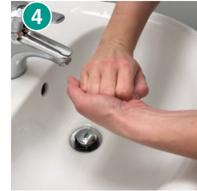
4 Außenseite der Finger auf gegenüberliegende Handflächen mit verschränkten Fingern reiben – Hände wechseln und wiederholen