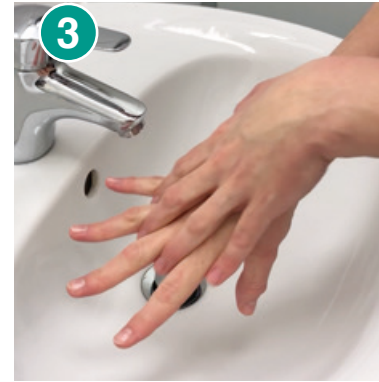
3 Handfläche über Handrücken mit gespreizten Fingern reiben – Hände wechseln und wiederholen