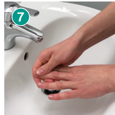
7 Nagelfalz aller Finger nacheinander mit dem Daumen reiben